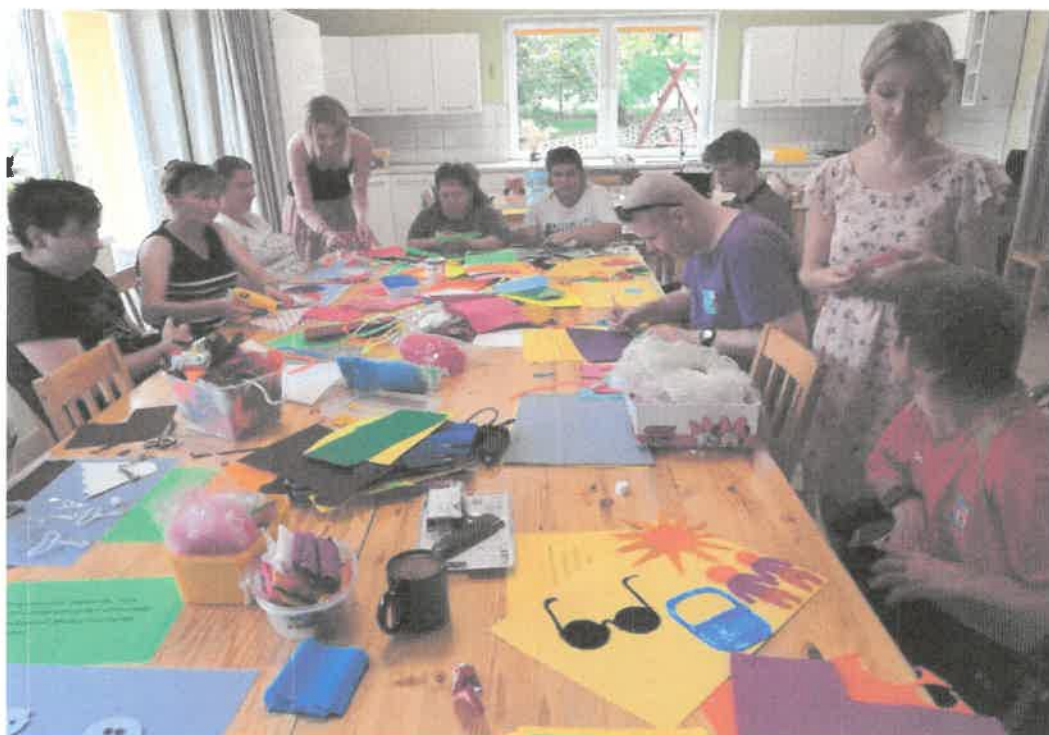
Zdjęcie nr 15. Tworzenie książki niezwyklej.