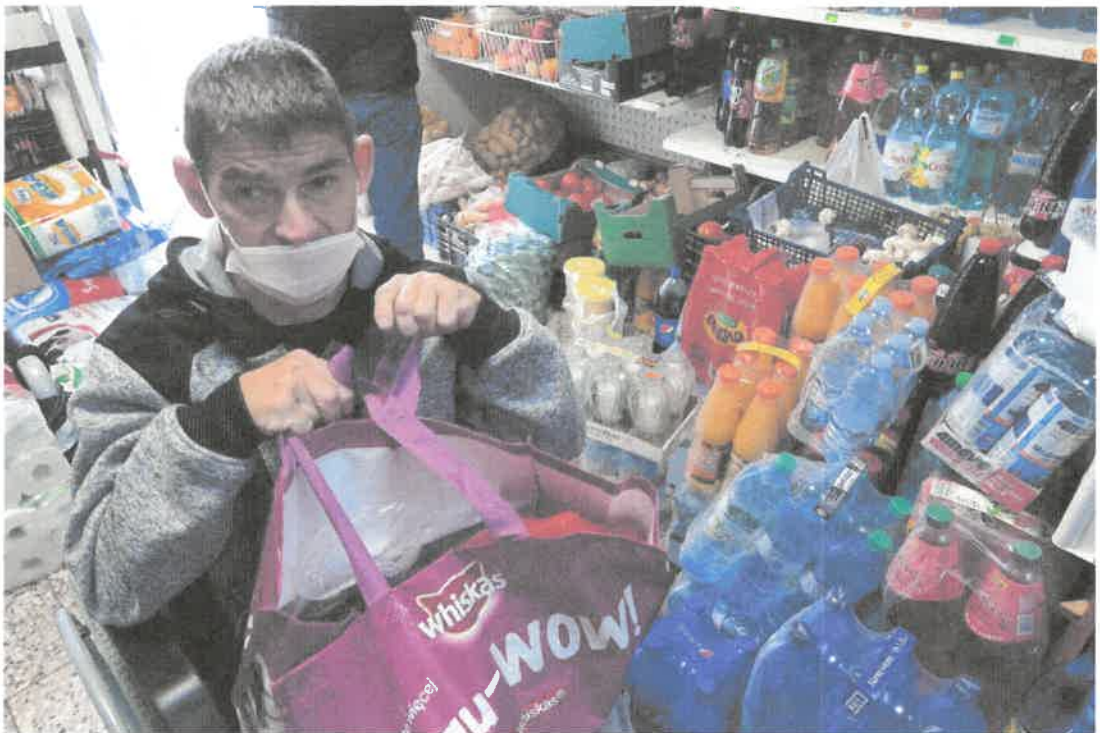
Zdjęcie nr 18. Zakupy zrobione.