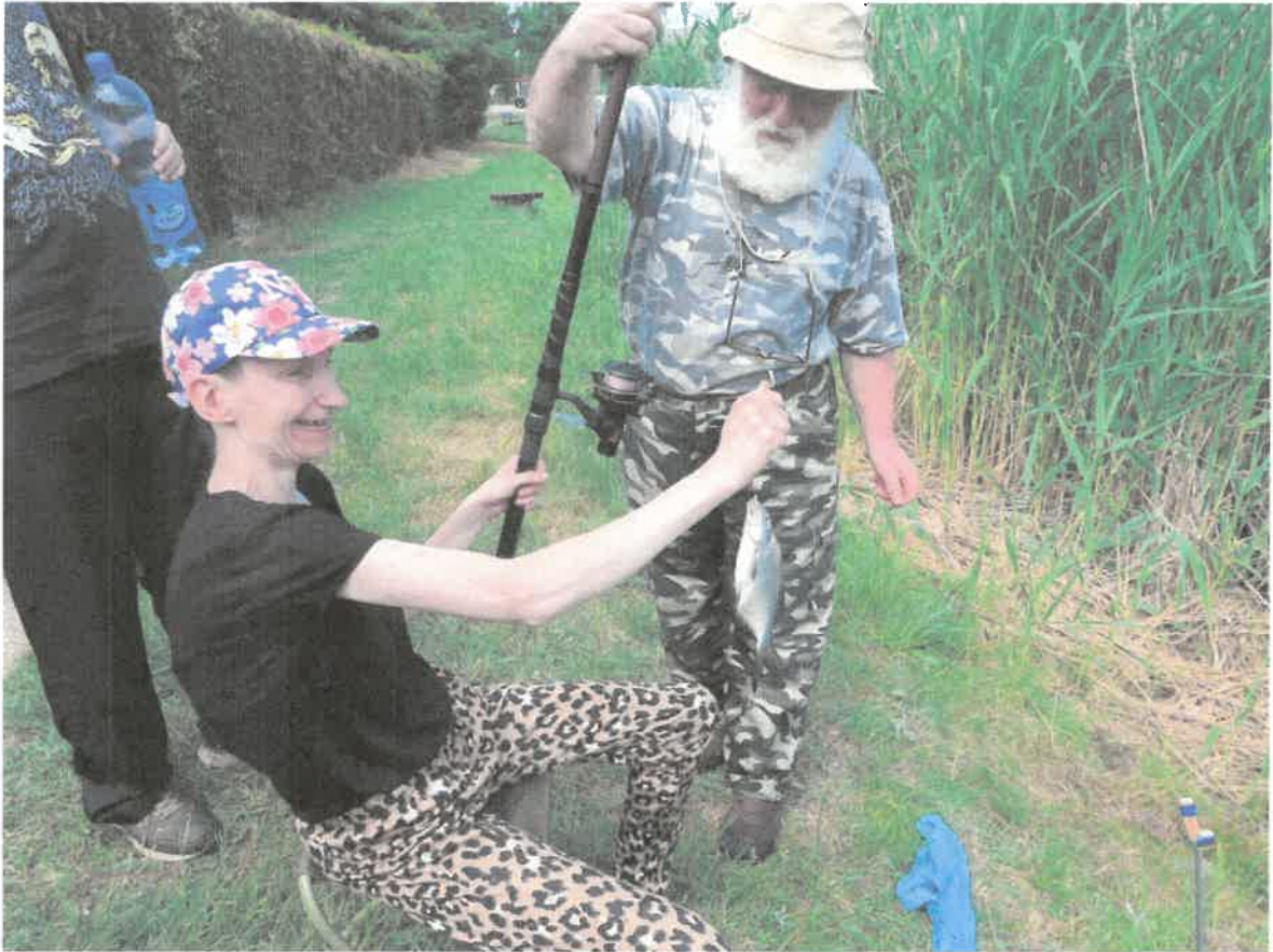
Zdjęcie nr 12. Taaaka ryba.