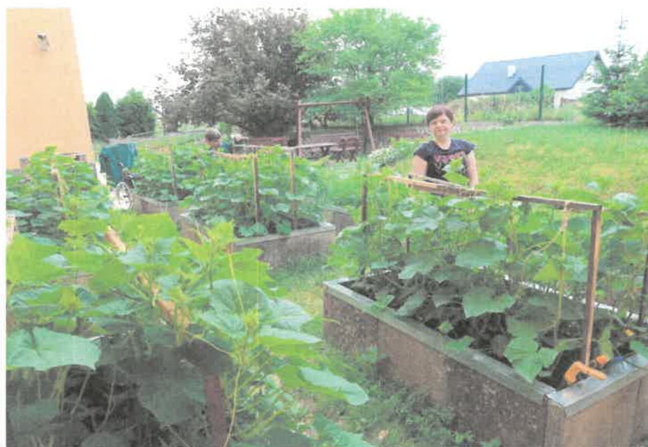
Zdjęcie nr 3. Praca w warsztatowym ogródku.

Instruktor często prowadził pogadanki na temat zachowania szczególnej ostrożności w czasie pandemii. W pracowni gospodarstwa domowego zajmowano się również przywarsztatowym ogródkiem. Uczestnicy dokonywali zasiewu warzyw oraz pielęgnacją roślin. Zebrane warzywa były myte, krojone i zamrażane. Usprawniali umiejętności związane z istotą uprawy warzyw i roślin. Dbali o teren wokół warsztatu pielęgnując skalnik. Uczyli się przestrzegania zasad bezpieczeństwa pracy w ogrodzie i na terenie warsztatu. Ponadto uczestnicy uczyli się wykonywania czynności pomocniczych, poznawanie tradycji świątecznych, korzystania z przepisów kulinarnych. Dbali o higienę w miejscu pracy uczyli się segregować sztućce i określali ich zastosowanie.