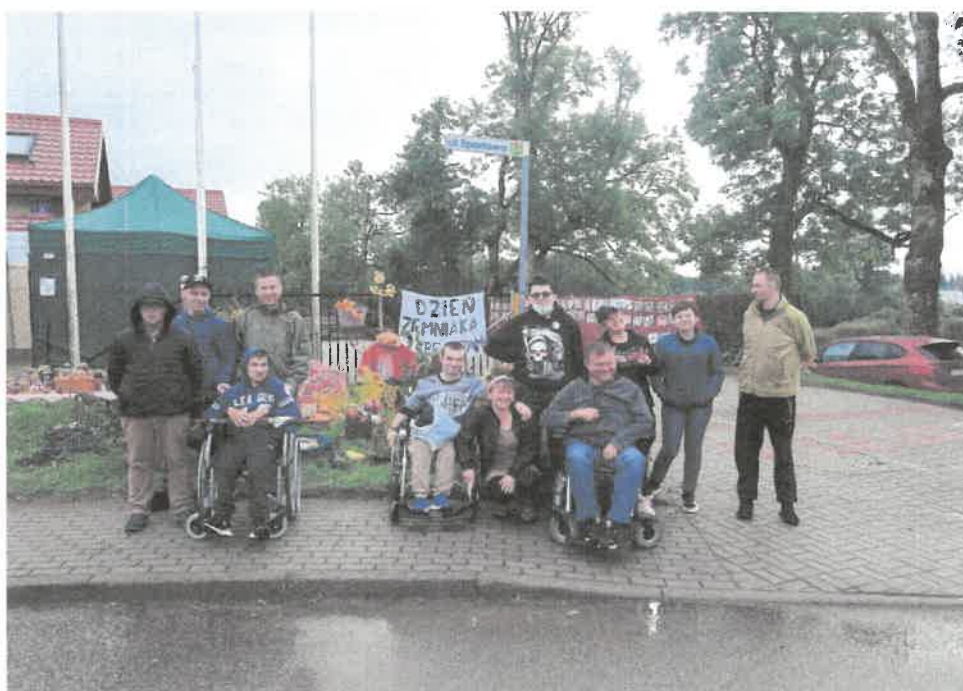
Zdjęcie nr 28. Gotowi do ziemniaczanego świętowania.

Przy świetlicy wiejskiej w Sycewicach odbył się dzień ziemniaka, organizowany przez Koło Gospodyń Wiejskich. Uczestnicy naszego warsztatu wzięli udział w tym wydarzeniu. Gospodynie serwowały frytki oraz placki ziemniaczane. Pogoda w tym dniu nie dopisywała jednak nie popsuła humoru i apetytu na takie przysmaki.