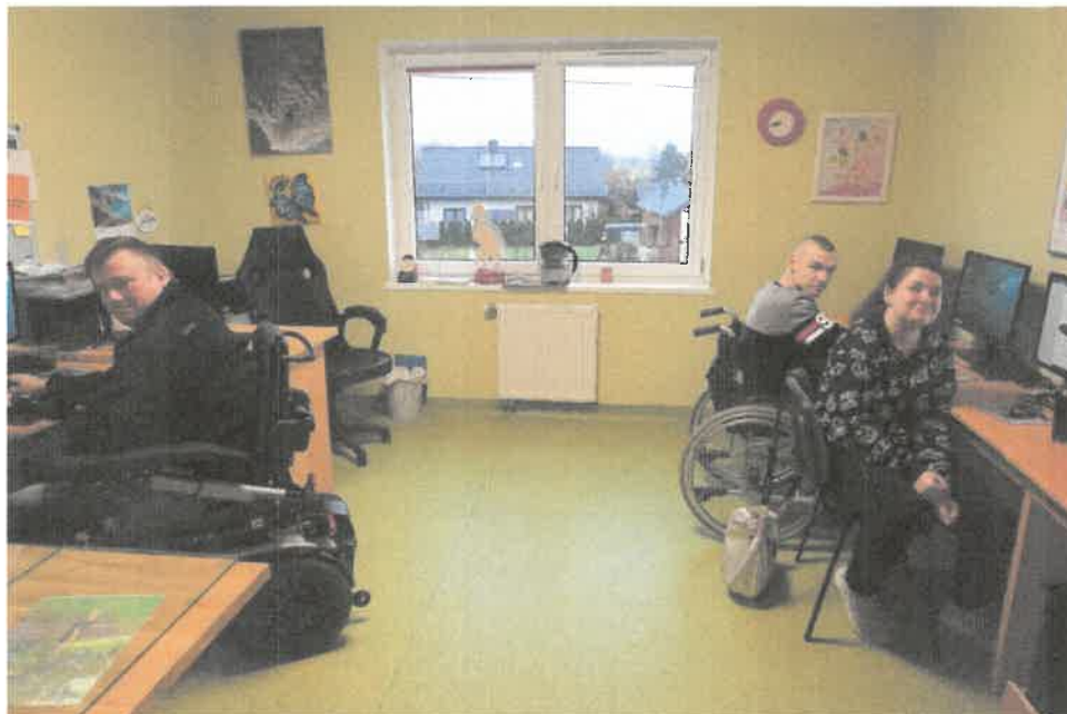
Zdjęcie nr 4. Uczestnicy w pracowni komputerowo-poligraficznej.

Różnorodność proponowanych w ramach terapii prac pozwoliła na odkrywanie przez podopiecznych zdolności w zakresie obsługi komputera oraz podnoszenie sprawności intelektualnej i manualnej. W pracowni komputerowo-poligraficznej uczestnicy utrwalali umiejętności związane z samodzielną obsługą sprzętu, tworzeniem dokumentów tekstowych, obróbką zdjęć w odpowiednich programach komputerowych. Uczestnicy grupy komputerowej uczą się bezpiecznie i efektywnie poruszać się po intrnecie, obsługiwać sprzęt komputerowy, posługiwać się programami. Efekty pracy to dokumenty tekstowe o naszej placówce wykazy życzeń kartki okolicznościowe skanowane prace i dyplomy zdjęcia. uczestnicy, usprawniają zdolność posługiwania się myszką, klawiaturą i korzystania z programów multimedialnych. Uczestnicy poznawali programy graficzne pod okiem instruktora, który uczył ich odpowiedniego ustawiania aparatu w zależności od warunków pogodowych i światła w pomieszczeniu. Uczyli się graficznej oprawy zdjęć. Zajęcia w pracowni komputerowo-poligraficznej ułatwiają dostęp do informacji, sprzyjają