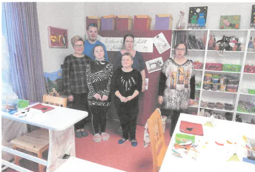
Zdjęcie nr 47. Uczestnicy konkursu” Kolorowy Jasiek”