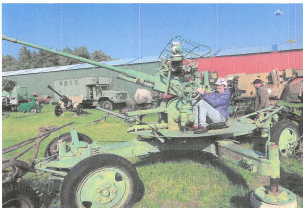
Zdjęcie nr 32 Sprawdzamy czy działo... działa?