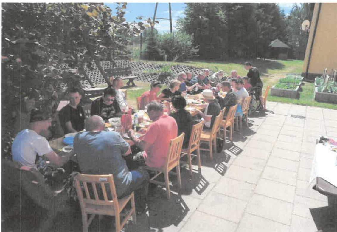
Zdjęcie nr 14. Wspólne biesiadowanie z wędkarzami.