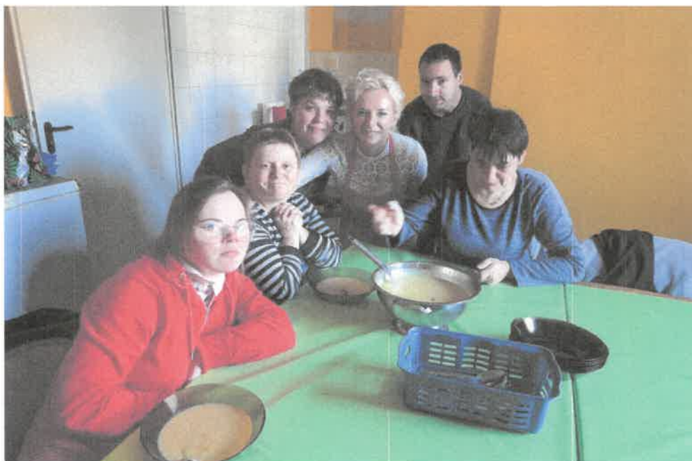
Zdjęcie nr 45. Wspólna degustacja przygotowanej zupy z dyni.