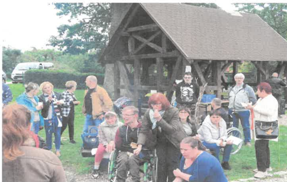
Zdjęcie nr 27. Wspólna biesiada w miłym towarzystwie.