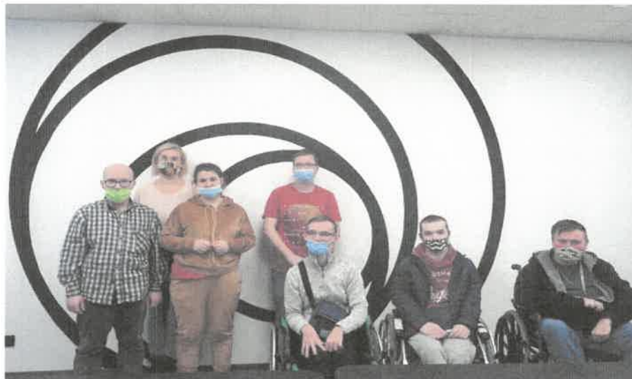
Zdjęcie nr 48. Spotkanie w punkcie informacyjnym Progresja.

Uczestnicy pracowni poligraficzno-komputerowej uczestniczyli w spotkaniu informującym o dofinansowaniach przydatnym osobom z niepełnosprawnością. Punkt informacyjny dla os. z niepełnosprawnościami prowadzi Fundacja Progresja w Słupsku. Jest to organizacja pozarządowa. Informują i udzielają wsparcia merytorycznego, psychologicznego i prawnego.