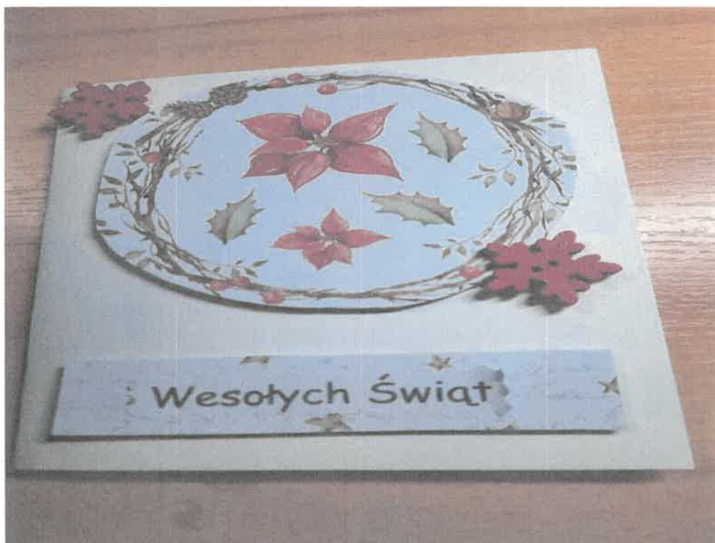
Zdjęcie nr 69. Kartki bożonarodzeniowe z pracowni komputerowo-poligraficznej.