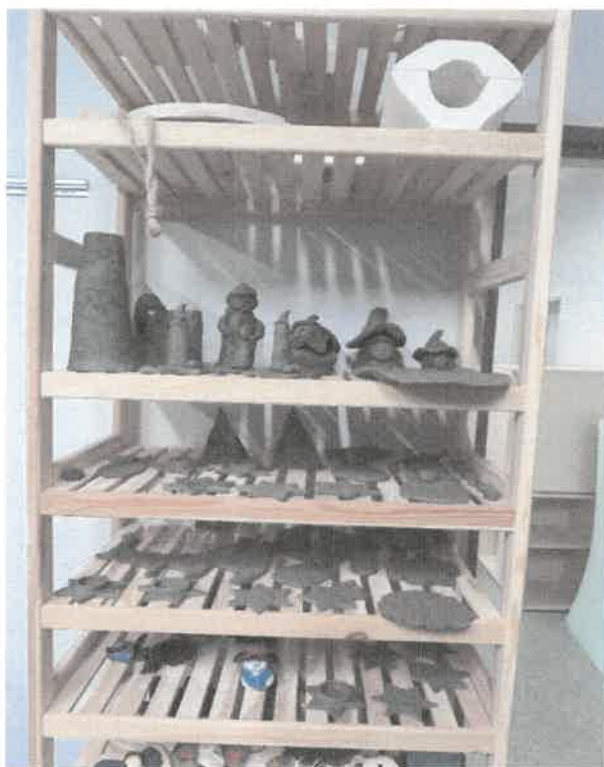
Zdjęcie nr 62. Prace uczestników Fundacji.