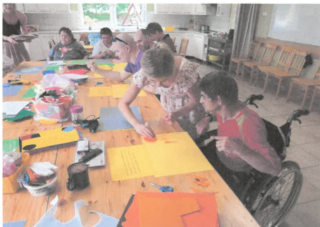
Zdjęcie nr 16. Kolejna strona ...niezwykła.