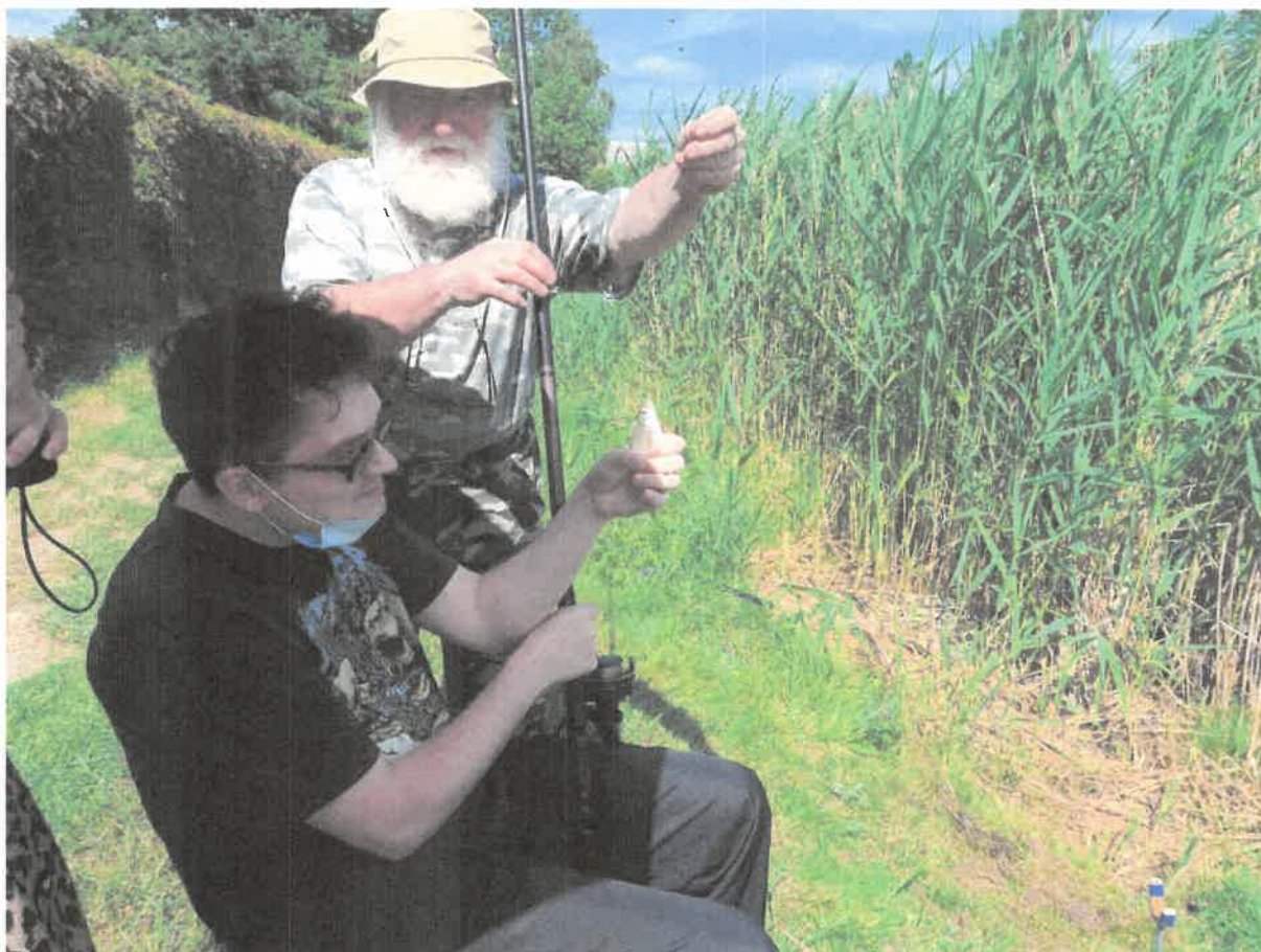
Zdjęcie nr 11. Wymiana wędkarskich doświadczeń.

Uczestnicy wzięli udział w zawodach wędkarskich. Zawody odbyły się w miłej atmosferze przy pięknej słonecznej pogodzie. Dla naszych uczestników to kolejny sezon, kiedy wraz z kolegami z PZW Sycevice, mogli doskonalić swoją wędkarską pasję. Wędkarze użyczyli sprzęt zaś nasze warsztaty zorganizowały poczęstunek: wspólny grill i biesiadowanie. Zwycięzcy otrzymali dyplomy i drobne upominki. Nasi podopieczni byli niepokonani w łowieniu ryb