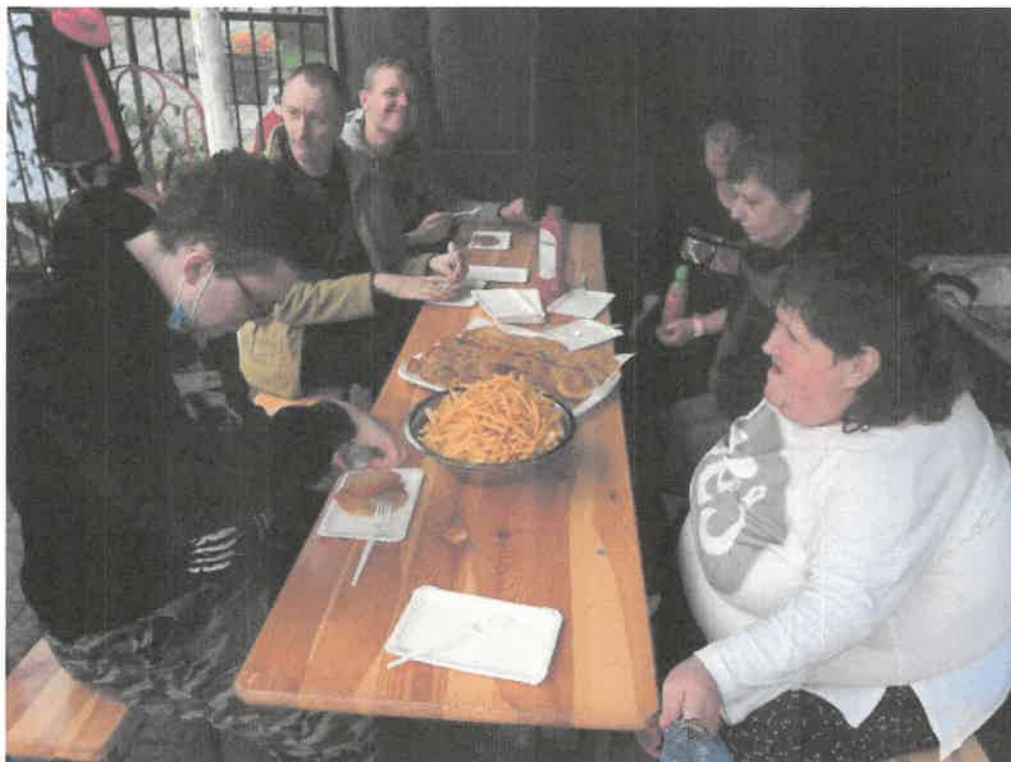
Zdjęcie nr 29. Wspólny posiłek smakuje najlepiej.