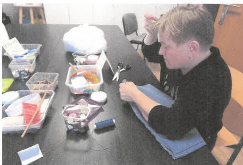
Zdjęcie nr 42. Konkurs krawiecki -igły poszły w ruch.