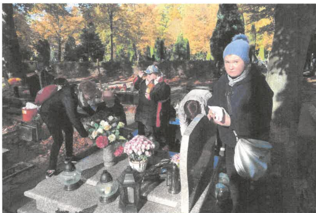
Zdjęcie nr 47. W naszych sercach i pamięci.