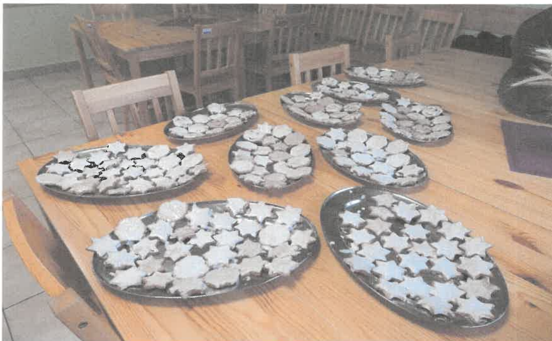
Zdjęcie nr 64. Dzieło pracowni gospodarstwa domowego.