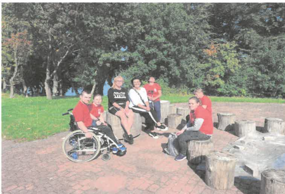
Zdjęcie nr 21. Integrujemy się i odpoczywamy.

Słoneczna pogoda, przyjazna atmosfera, ciekawy program oraz gościnność Ośrodka Turystycznego w Warzenku sprawiły, że nasi uczestnicy przeżyli niesamowity dzień pełen wrażeń.