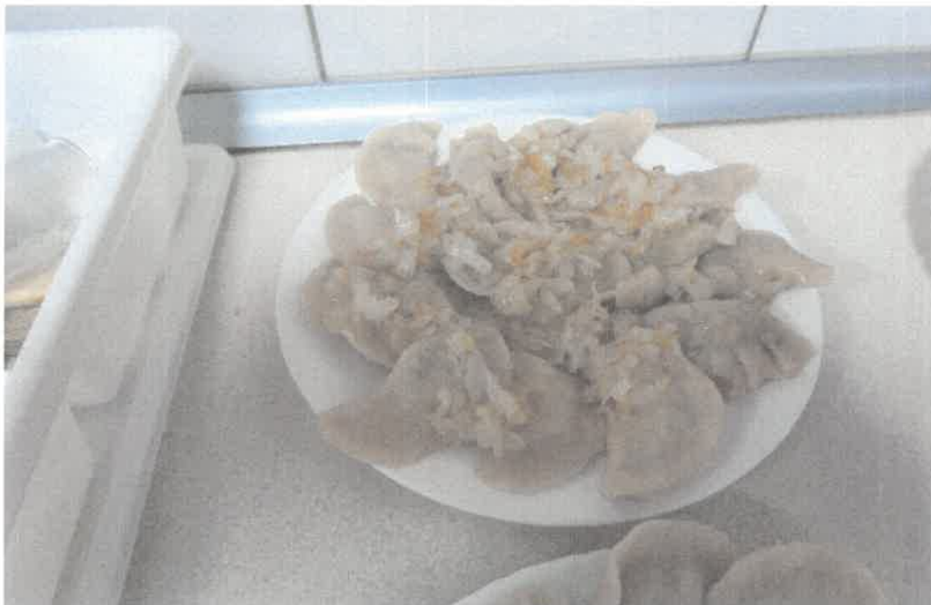
Zdjęcie nr 58. Efekt wspólnego gotowania.