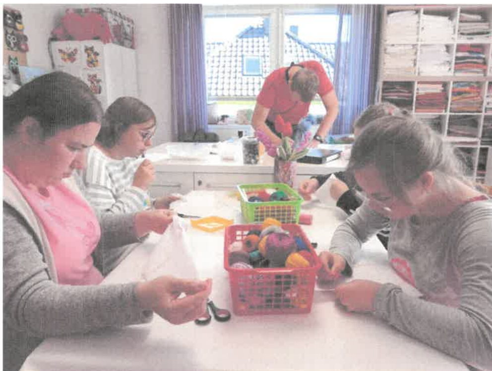
Zdjęcie nr 5. Uczestnicy w pracowni krawiecko-dekoratorskiej.

W pracowni prowadzone są zajęcia z zakresu szycia ręczne i maszynowe, prucie i zwijanie wełny, haftowanie, aplikacje, wykonywanie kartek świątecznych z wykorzystaniem różnych technik. Zajęcia w pracowni to głównie formy prac indywidualnych, i grupowych. Uczestnicy zdobywają tutaj takie umiejętności jak: