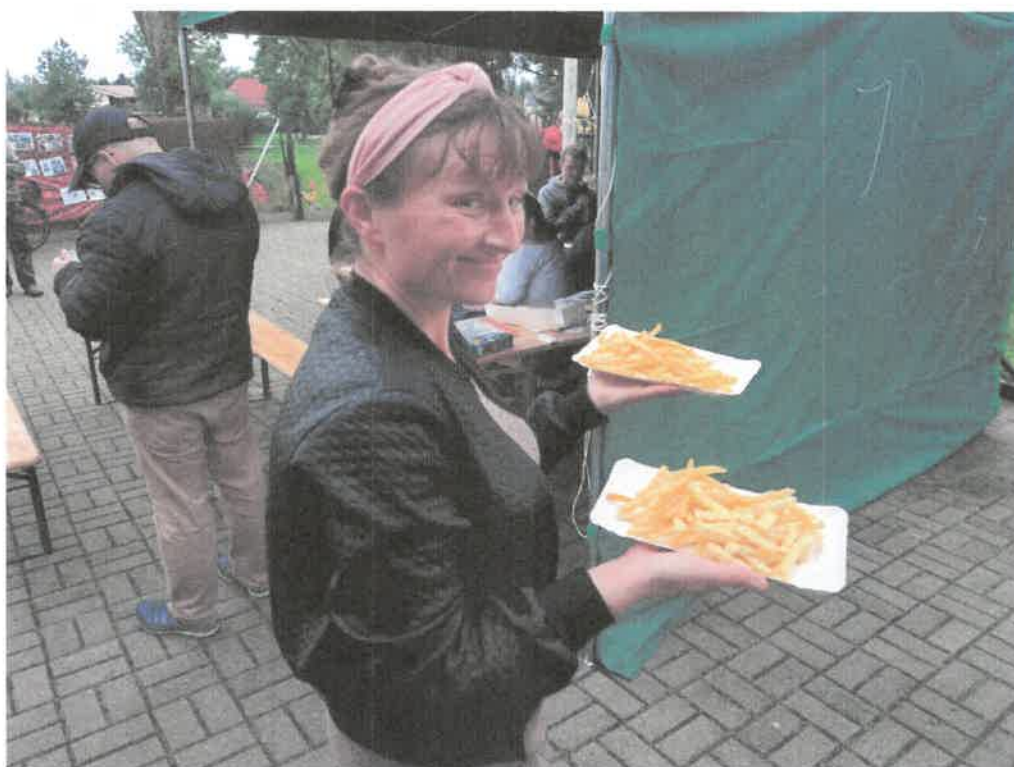
Zdjęcie nr 30. Ulubione fryteczki .