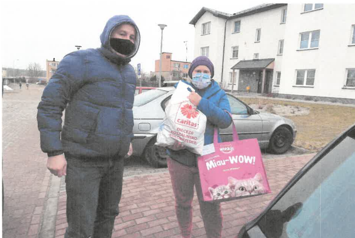
Zdjęcie nr 9. Pracę czas zacząć.