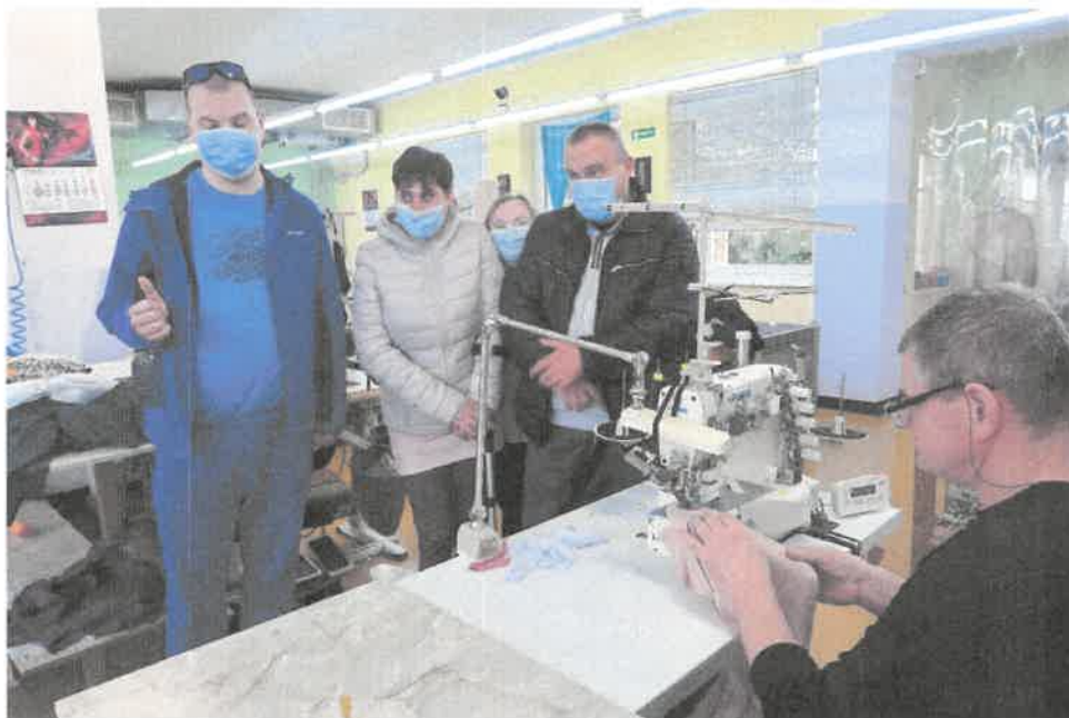
Zdjęcie nr 41. Zapoznanie z pracownikami i funkcjonowaniem przedsiębiorstwa.