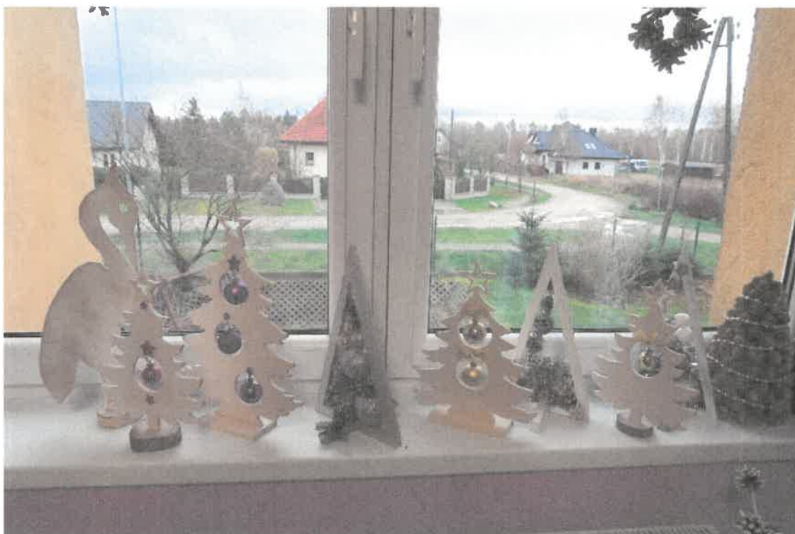
Zdjęcie nr 65. Współpraca pracowni plastyczno-muzycznej i stolarsko-rzemieślniczo-ślusarskiej.