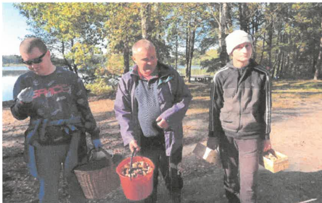
Zdjęcie nr 36. Grzybobranie udane.... są pełne kosze.

15 września 2021 r. odbyło się grzybobranie. Uczestnicy poznawali zasady zachowania się w lesie, poruszania się w nim tak, aby się nie zagubić, poznawali drzewostan, a przede