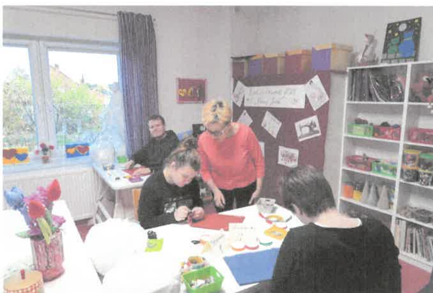
Zdjecie nr 46. Rywalizujemy, ale i wspólnie pracujemy.