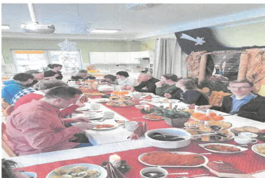
Zdjęcie nr 63. Wspólna Wigilia 2021r.