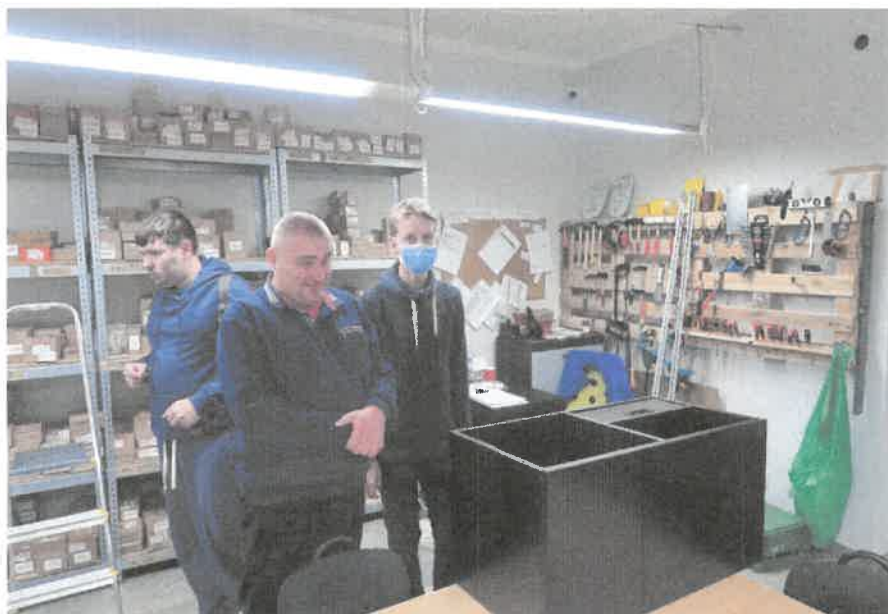
Zdjęcie nr 61. Zwiedzanie pracowni stolarskiej.