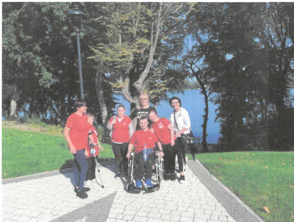
Zdjęcie nr 20. Wyjazd do Warzenka, zwiedzamy.

Dnia 07.09.2021 r. uczestnicy WTZ w Sycewicach wzięli udział w spotkaniu Warsztatów Terapii Zajęciowych w Warzenku. Wyjazd został zorganizowany przez Caritas Archidiecezji w Gdańsku. Celem wyjazdu była integracja między Warsztatami Terapii Zajęciowej. Program spotkania umożliwił uczestnikom korzystanie z różnych zajęć terapeutycznych.