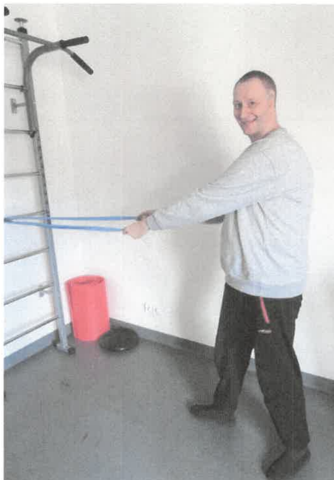
Zdjęcie nr 37. Ćwiczymy sprawność i kondycję.

Nasz warsztat oferuje opiekę dla naszych uczestników. Fizjoterapia to niezbędny element procesu rehabilitacji osób z niepełnosprawnością ruchową. Pod fachowym okiem rehabilitanta nasi uczestnicy usprawniają swoją kondycję. Celem działań fizjoterapeutycznych jest działanie w kierunku usprawniania ogólnego oraz praca indywidualna. Zajęcia są dostosowane do rodzaju schorzenia i możliwości uczestnika.