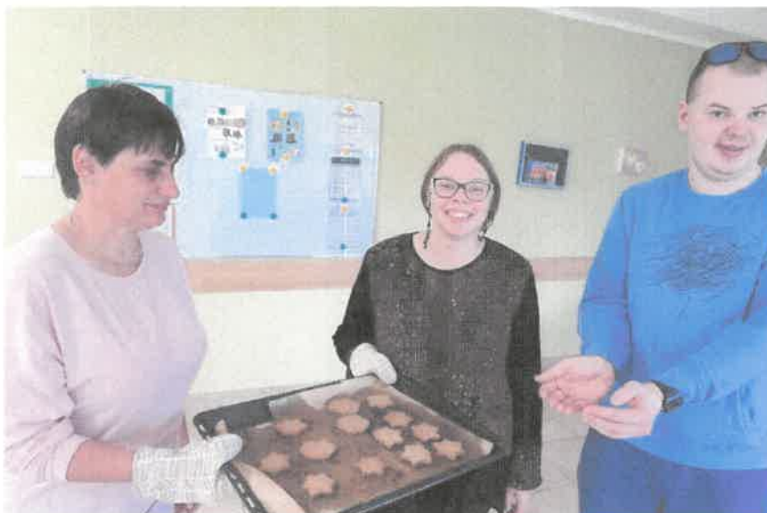
Zdjęcie nr 2. Zajęcia w pracowni gospodarstwa domowego.

Uczestnicy pracowni gospodarstwa domowego w prowadzonej terapii nabywali umiejętności: