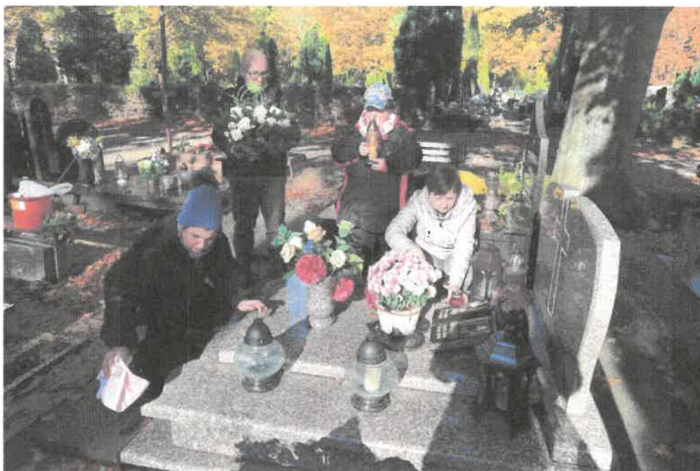
Zdjęcie nr 46. Pamiętamy o grobach bliskich i nie tylko.

Uczestnicy tradycyjnie odwiedzili groby-bliskich, którzy odeszli, ale też tych, o których już nikt nie pamięta.