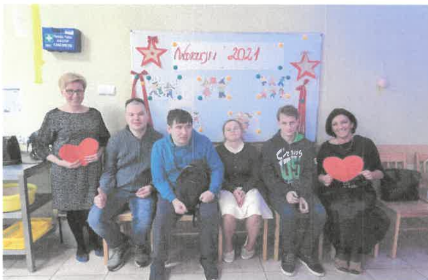
Zdjęcie nr 49. Wspólna zabawa andrzejkowa.

Na terenie naszego WTZ odbyła się zabawa andrzejkowa. Ten wyjątkowy dzień obfitował w wiele atrakcji. Zgodnie z tradycją spotkaniu towarzyszyły wróżby i przepowiednie andrzejkowe, które stały się tematem wesołych rozmów i żartów.