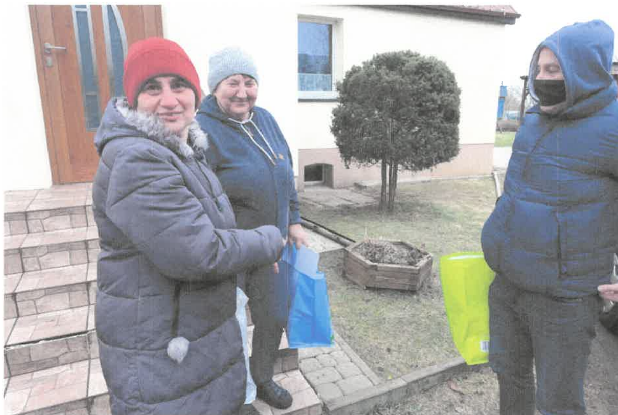
Zdjęcie nr 10. Materiały do pracy przekazane.

Terapia i rehabilitacja uczestników w WTZ w Sycewicach z powodu Pandemii COVID-19 w okresie od 14 czerwca do 31 grudnia 2021r. odbywała się w systemie hybrydowym z uwzględnieniem wszystkich środków ostrożności.