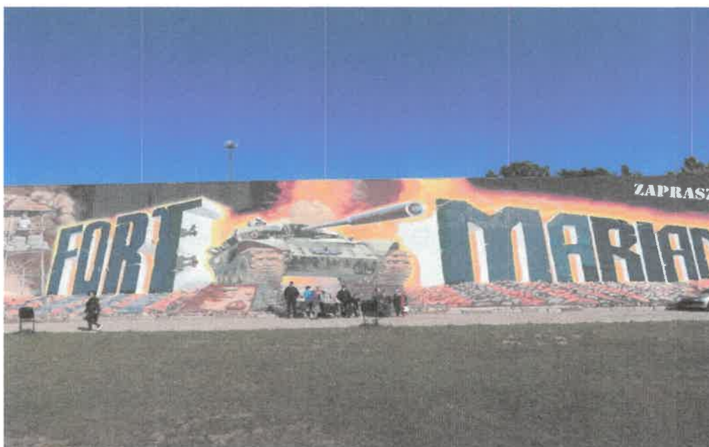
Zdjęcie nr 31. Wycieczka do Fort Marian w Malechowie.

Ciekawa wycieczka, która zapoznała i umożliwiła uczestnikom przybliżyć część historii. Muzeum znajduje się w Malechowie w FORCIE MARIAN. W swojej kolekcji muzeum posiada wiele unikatowych pojazdów wojskowych, kolekcje motocykli. Na terenie muzeum znajdują się pozostałości największego bunkra stalowego do testowania amunicji.