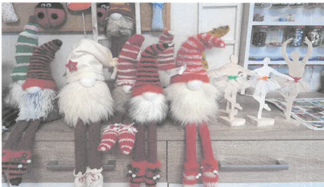
Zdjęcie nr 67. Ekipa skrzatów i tancerek z pracowni krawiecko-dekoratorskiej.