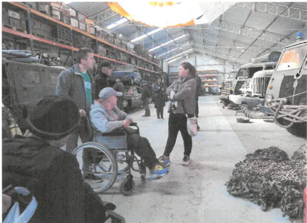
Zdjęcie nr 34. Zwiedzanie muzeum militarnego.