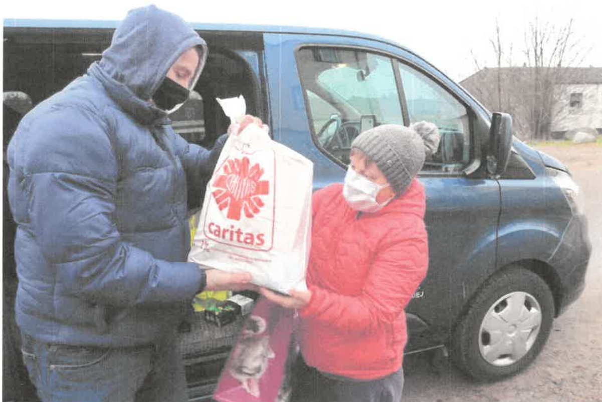
Zdjęcie nr 8. Przekazanie materiałów do pracy... będzie się działo.