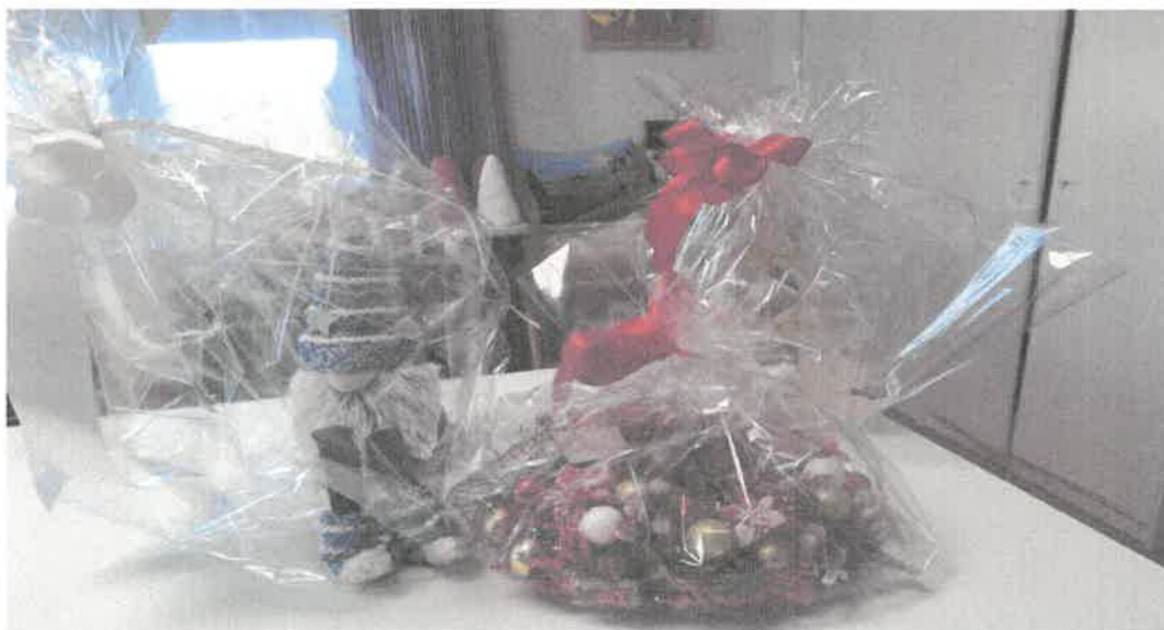
Zdjęcie nr 59. Prace naszych uczestników które zostały przekazane na cel Charytatywny

Łączymy serca pod wspólną nazwą CARITAS NASZEJ DIECEZJI