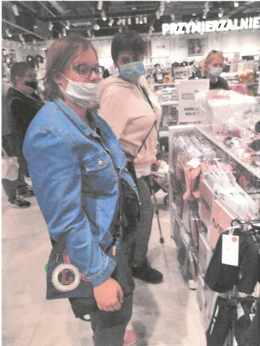
Zdjęcie nr 17. Trenujemy i kupujemy.

Trening ekonomiczny to okazja, aby nasi podopieczni nauczyli się sami wydatkować pieniądze, poznali ich wartość jak również nabywali umiejętności radzenia sobie w sytuacjach nowych i stresujących. Zakupy udane. Wszyscy zadowoleni czekają na następną okazję, aby kupić sobie coś przydatnego.