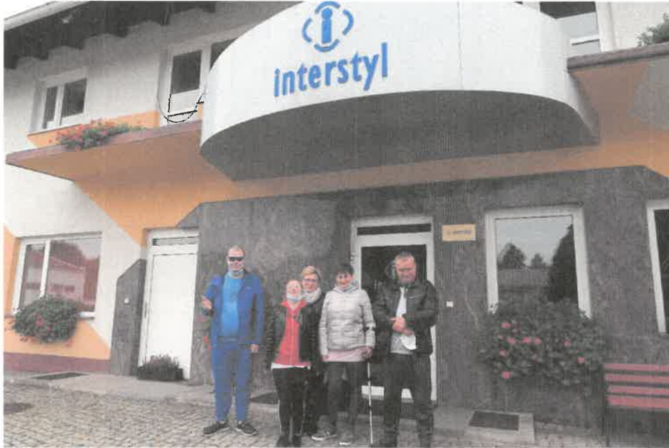
Zdjęcie nr 40. Z wizytą w przedsiębiorstwie „Interstyl”.

Pracownia krawiecko-dekoratorska uczestniczyła z wizytą w przedsiębiorstwie specjalizującym się w produkcji odzieży lekkiej, damskiej, młodzieżowej. Personel firmy to osoby z orzeczeniem o niepełnosprawności. Właścicielka opowiedziała o działalności firmy oraz oprowadziła uczestników po halach produkcyjnych, gdzie można było zobaczyć, jak pracownicy obsługują komputerowy system przygotowania produkcji.