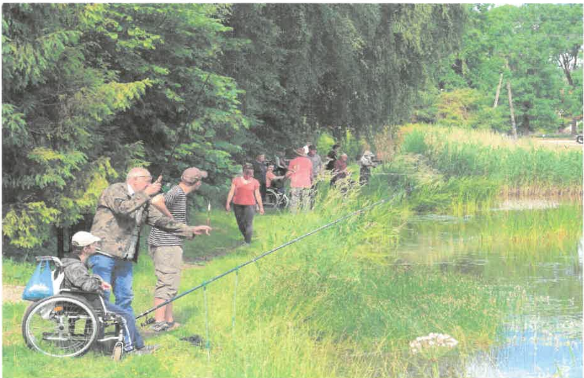
Zdjęcie nr 13. Oby rybka wzięła.