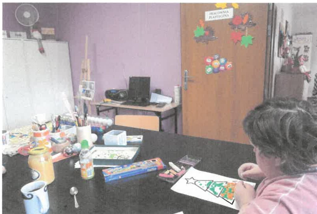
Zdjęcie nr 6. Zajęcia w pracowni plastyczno-muzykoterapii.

Pracownia plastyczno – muzykoterapii realizowała zadania terapeutyczne poprzez kontakt ze sztuką oraz wykonywanie prac plastycznych różnorodnymi technikami. W pracowni uczestnicy poznawali różne formy wyrazu artystycznego. Na zajęciach plastycznych posługiwano się materiałami takimi jak; farby akwarelowe, plakatowe, pastele, kredki, plastelina kolorowy papier, a także materiały naturalne typu szyszki, suszone, trawy i kwiaty oraz liście.