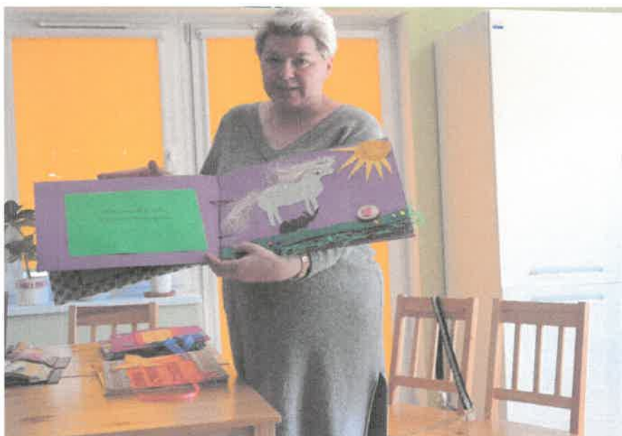
Zdjęcie nr 24. Prezentacja książki wykonanej przez naszych uczestników.