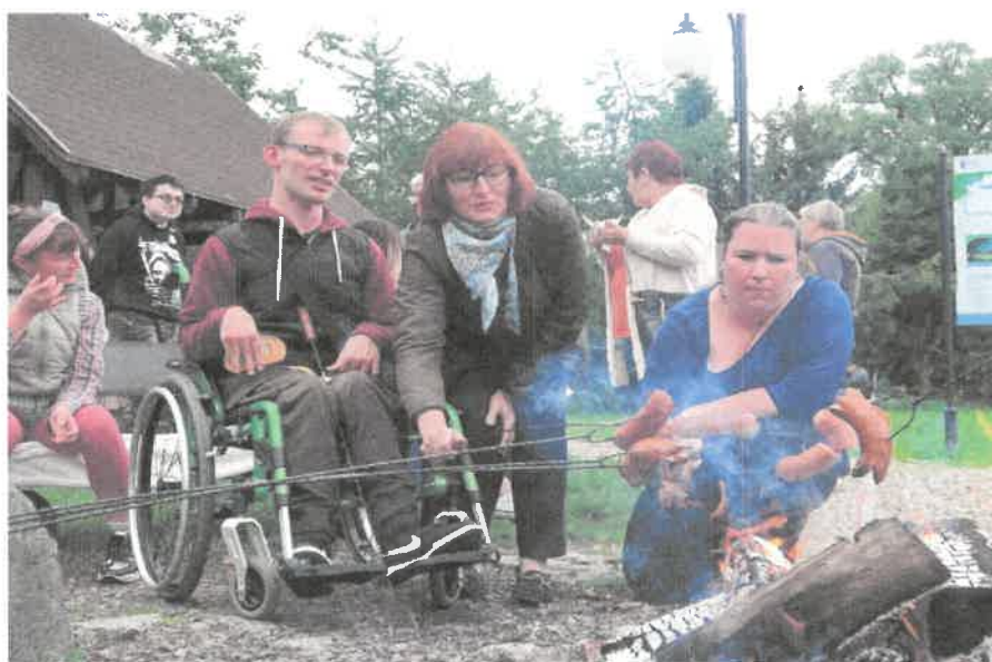
Zdjęcie nr 26. Kielbaski będą pyszne.