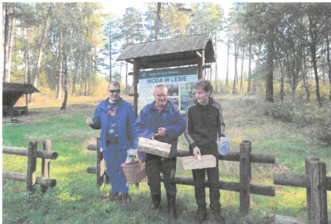
Zdjęcie nr 35. Wyprawa do lasu na grzyby.