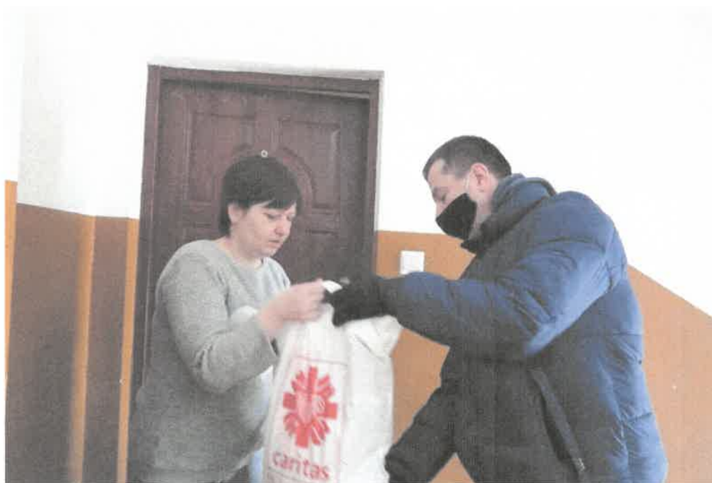
Zdjęcie nr 7. Przekazanie materiałów do pracy.

Instruktorzy utrzymywali kontakt telefoniczny, zarówno z uczestnikami jak i z rodzicami/opiekunami. Uczestnicy chętnie współpracowali co widać na załączonych zdjęciach.