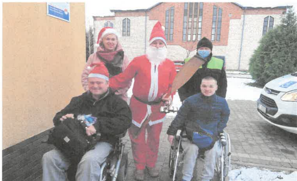
Zdjęcie nr 54. Wizyta Mikołaja.

Uczestnikow odwiedził Mikołaj, który obdarował wszystkich upominkami. Mikołaj nie tylko rozdał słodkości ale i zaganiał do pracy. Okrzyknał nas swoimi pomocnikami. Ten dzień to tradycja, która sięga jeszcze czasów starożytnych.