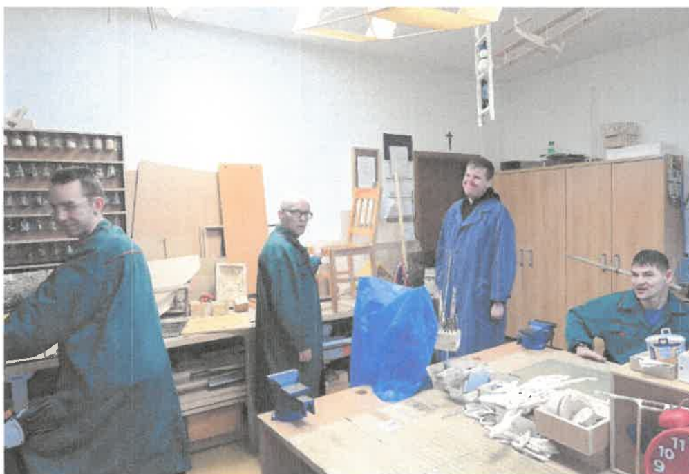
Zdjęcie nr 1. Zajęcia w pracowni stolarsko – rzemieślniczo – ślusarskiej.

W zajęciach pracowni stolarsko – rzemieślniczo – ślusarskiej brało udział 5 osób. Podczas zajęć uczestnicy poznawali obsługę podstawowych narzędzi ręcznych do obróbki drewna i materiałów drewnopodobnych. W miarę nabywania umiejętności uczyli posługiwać się elektronarzędziami (wiertarką elektryczną, wkrętarką akumulatorową, szlifierką taśmową