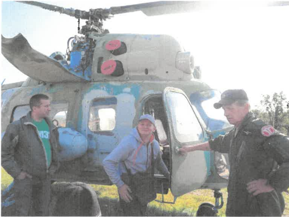
Zdjęcie nr 33. Czy leci z nami pilot?