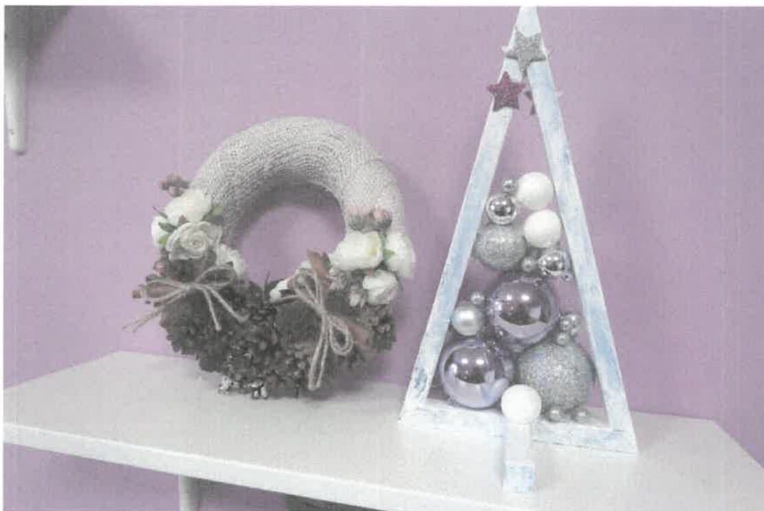
Zdjęcie nr 66. Dekoracje wykonane w pracowni plastyczno - muzykoterapii.