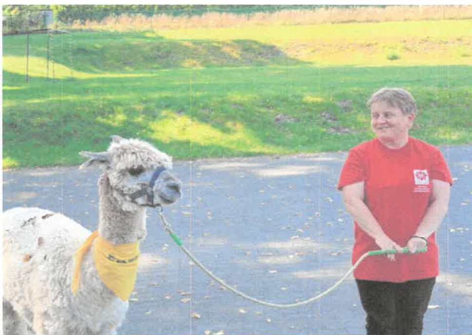
Zdjęcie nr 22. Spacer z alpaka.