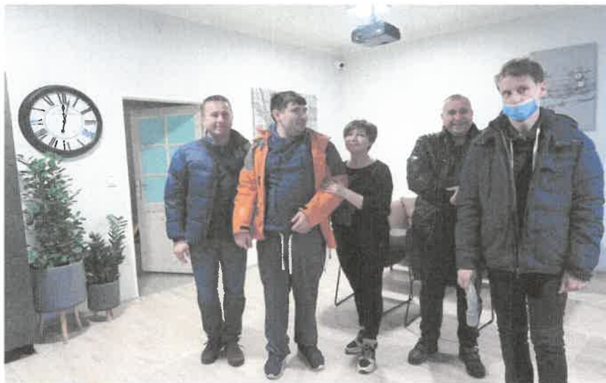
Zdjęcie nr 60. Z wizytą w Fundacji.