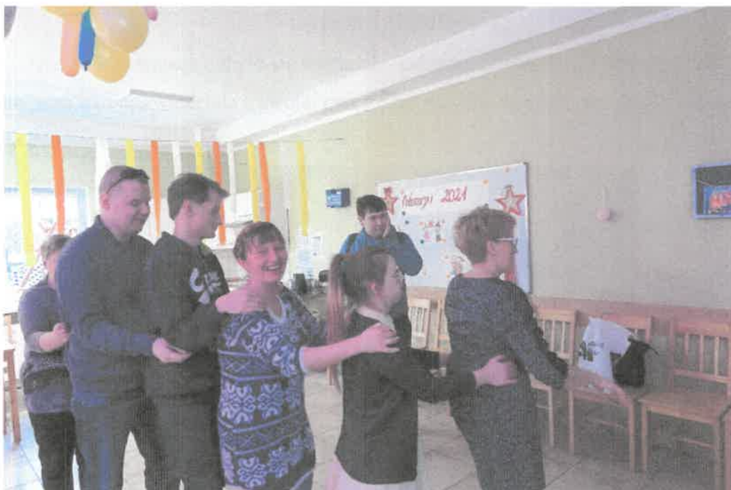
Zdjęcie nr 50. Tańce w rytmie disco.