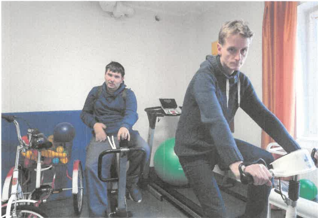
Zdjęcie nr 39. Ćwiczymy i usprawniamy się.