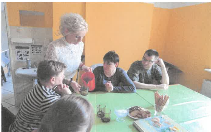
Zdjęcie nr 43 Z wizytą w PSONI. Przywitanie przy herbatce i słodkościach.

Przygotowano smaczną i pożywną zupę – krem z dyni, po czym w miłej atmosferze spędzono wspólny czas wymieniając się doświadczeniami i pomysłami kulinarnymi.