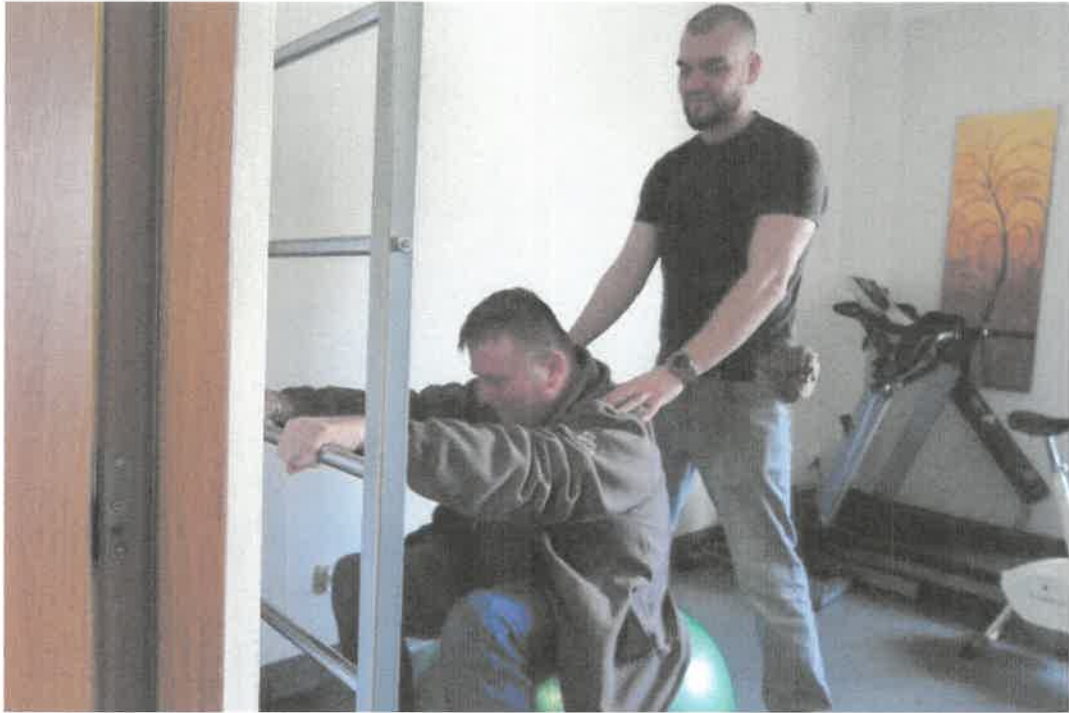
Zdjęcie nr 38 Trening czyni mistrza.