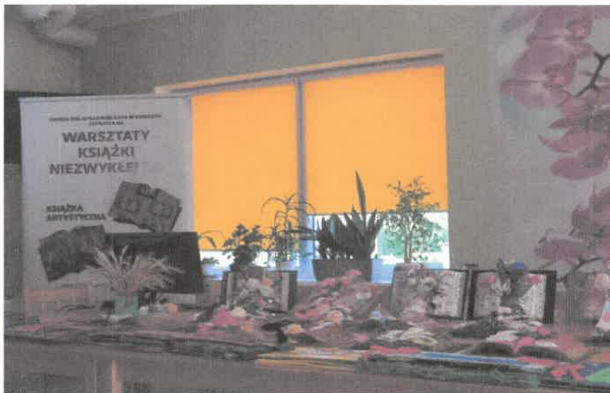
Zdjęcie nr 23. Wystawa książki niezwykłej.