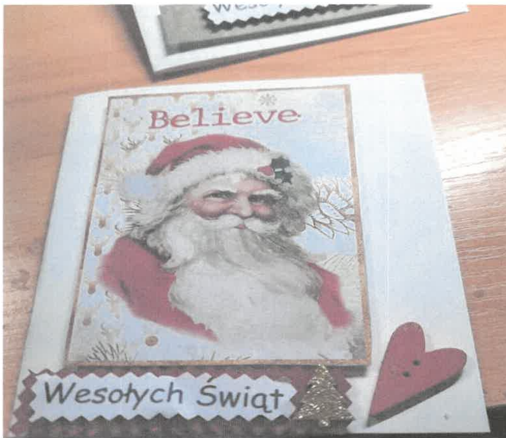
Zdjęcie nr 68. Kartki świąteczne.