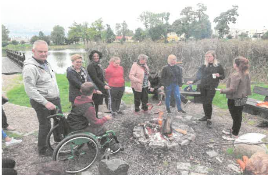
Zdjęcie nr 25. Spotkanie przy ognisku.

Piękna pogoda, miłe towarzystwo i smaczne jedzenie oraz dobry humor, który dopisywał wszystkim to przepis na sukces.