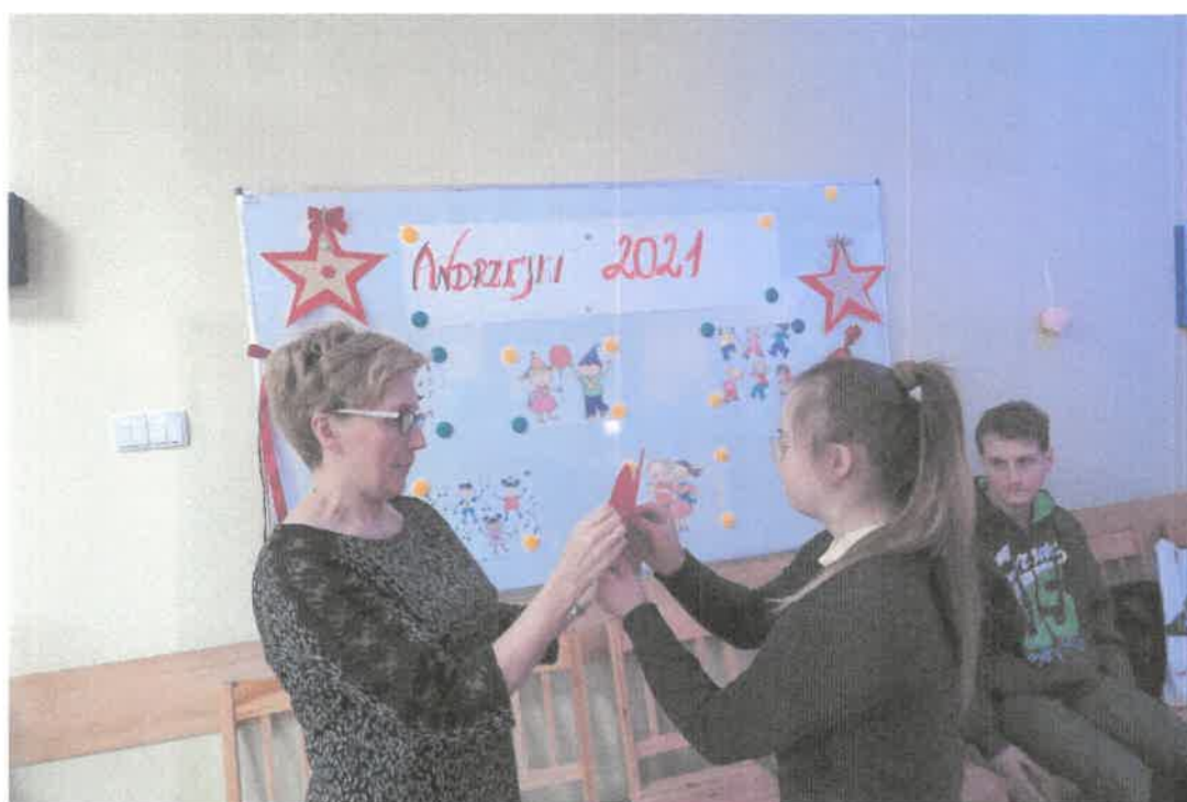
Zdjęcie nr 51. Pani Hania również powróżyła uczestnikom.