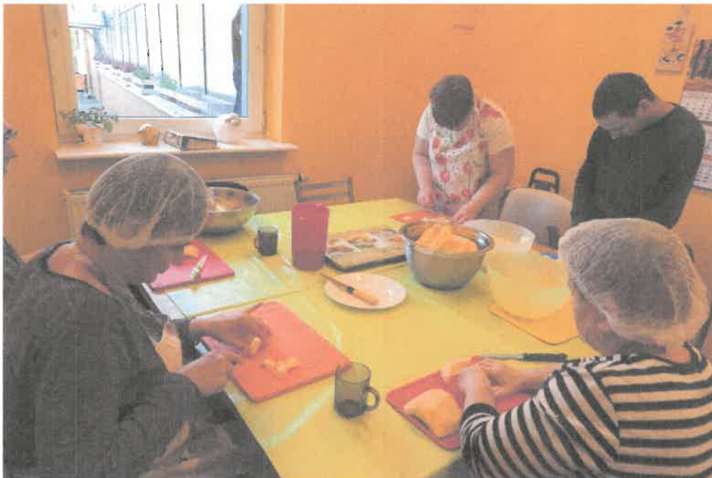
Zdjęcie nr 44. Wspólne gotowanie ...będzie pyszna zupka.